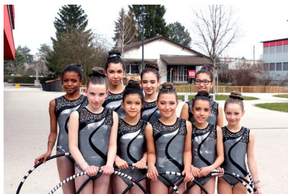
groupe des moyennes aux cerceaux, mars 14

Après les Journées Genevoises qui se sont déroulées à Aïre-Le-Lignon les 29 et 30 mars 2014, pendant lesquelles 6 de nos gymnastes ont obtenu le passage de leur test, les monitrices, aidées par du renfort extérieur bienvenu, ont procédé à plusieurs modifications de chorégraphies, liées à de nouvelles règles de jugement, tandis que l'organisation des Championnats Genevois se mettait en place au sein de notre comité administratif.